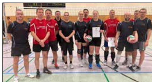
Impressionen

Alle Teilnehmenden empfanden den Wettkampf als sehr gelungen und freuen sich bereits auf das Zusammentreffen im nächsten Jahr.