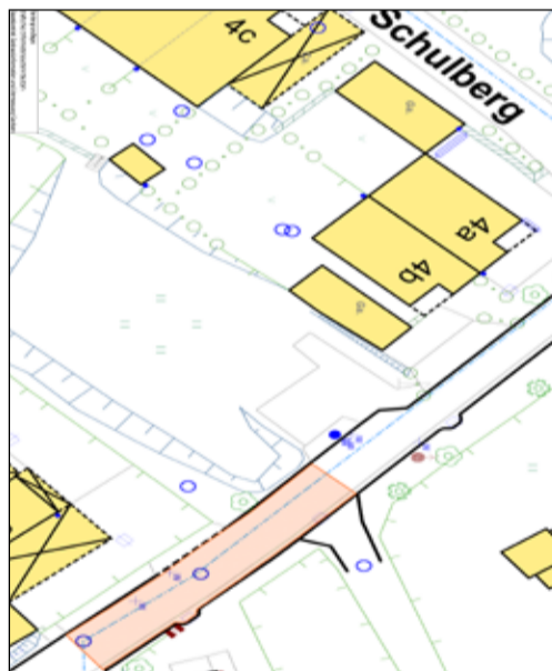
Lageplan zur Widmungsverfügung