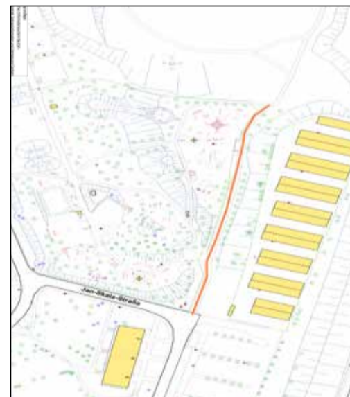
Lageplan zur Widmungsverfügung