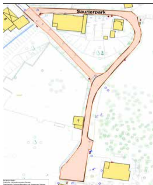
Lageplan zur Widmungsverfügung